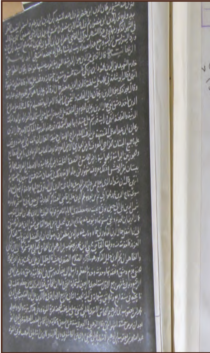
٤- الورقة الأخيرة، وفيها ترجمة المدرسة الريحانية