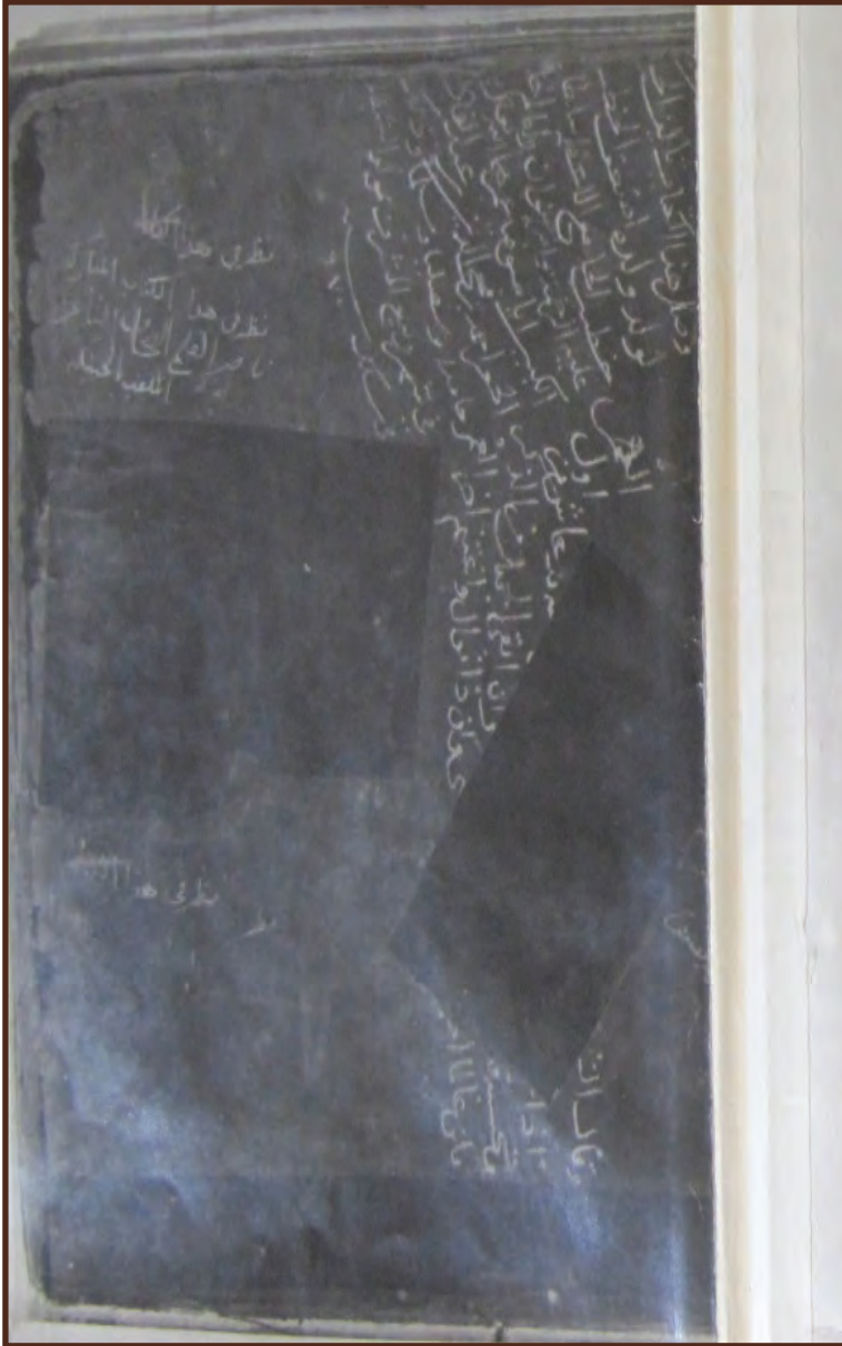
٢- ورقة يظهر فيها تملك حفيد المصنف