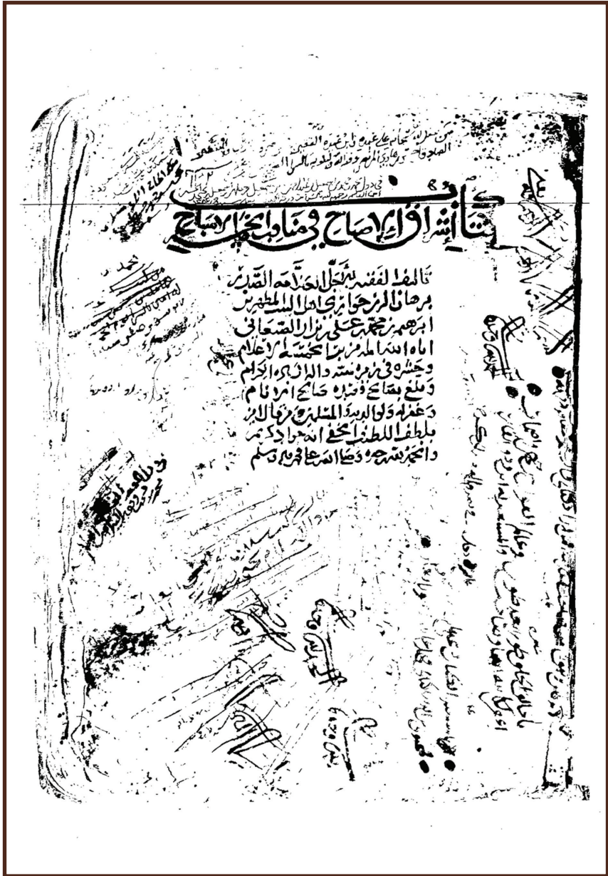
الصفحة الأولى من كتاب (اشراق الاصباح في فضائل الخمسة الأشباح)