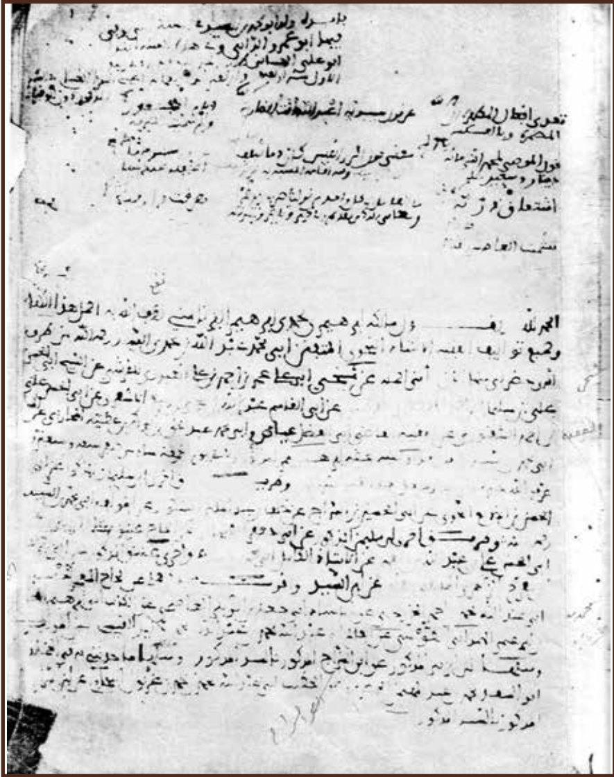
صفحة سند رواية الكتاب وغيره من كتب ابن السنيّد